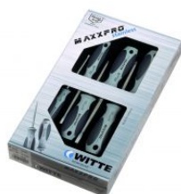
Juegos de destornilladores MAXXPRO Inoxidable at.com.es/p/1017300