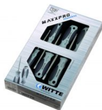
Juegos de destornilladores MAXXPRO Inoxidable at.com.es/p/1017300