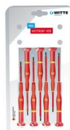
Juego de destornilladores de precisión WITTRON VDE en blister de plástico