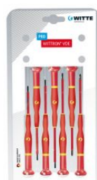
Juego de destornilladores de precisión WITTRON VDE en blister de plástico