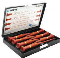
Juegos de destornilladores de precisión WITTRON VDE en estuche de plástico antichoque