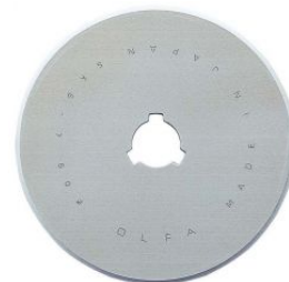
Cuchilla circular de 60 mm