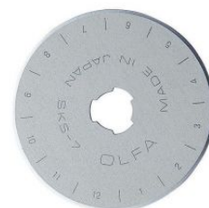
Cuchilla circular de 45 mm