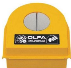
Contenedor grande para cuchillas usadas DC-2