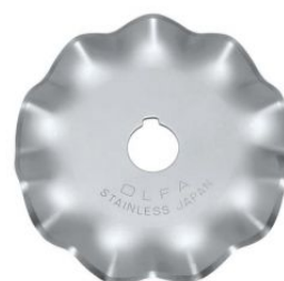
Cuchilla circular de 45 mm con forma de onda