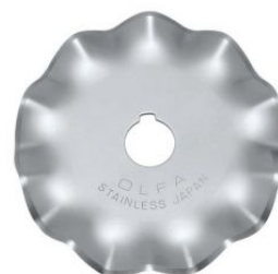
Cuchilla circular de 45 mm con forma de onda