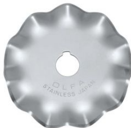
Cuchilla circular de 45 mm con forma de onda