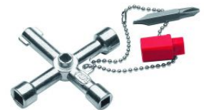
Llave universal para armarios eléctricos y cuadros de control at.com.es/p/1017586