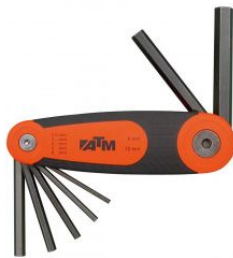
Juego de 7 llaves Allen en soporte tipo navaja at.com.es/p/1017464