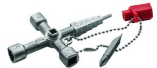
Llave universal para armarios de distribución y edificios at.com.es/p/1017585