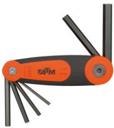
Juego de 6 llaves Allen en soporte tipo navaja at.com.es/p/1017463