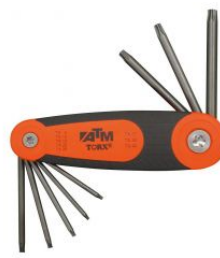
Juego de 8 llaves Torx en soporte tipo navaja at.com.es/p/1017471