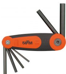
Juego de 6 llaves Allen en soporte tipo navaja at.com.es/p/1017463