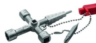
Llave universal para armarios de distribución y edificios at.com.es/p/1017585