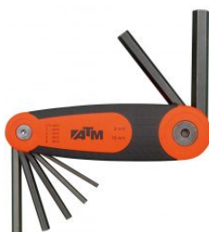
Juego de 7 llaves Allen en soporte tipo navaja at.com.es/p/1017464