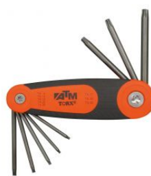
Juego de 8 llaves Torx en soporte tipo navaja at.com.es/p/1017471