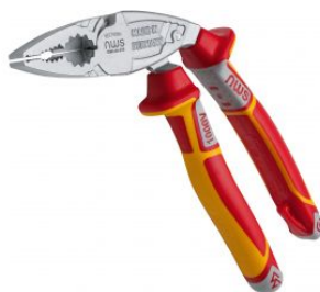
Alicate multifunción de cabeza acodada 45° Serie 49 VDE