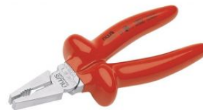
Alicate universal 1000V Serie 43