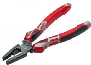
Alicate CombiMax Serie 69