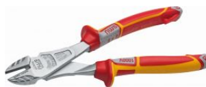
Alicate corte diagonal modelo americano Serie 49 VDE at.com.es/p/1017608