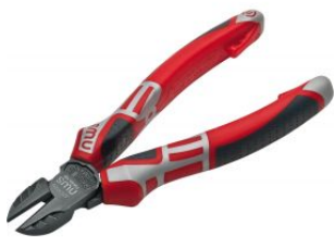
Alicate corte diagonal modelo sueco Serie 69 at.com.es/p/1017563