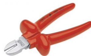
Alicate corte diagonal modelo sueco 1000V Serie 43 at.com.es/p/1017618