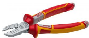
Alicate corte diagonal electricista Serie 49 VDE at.com.es/p/1017607