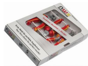
Juego de alicata universal de 180, alicata corte diagonal de 160 y alicata boca semiredonda recta de 205 Serie 49 VDE at.com.es/p/1017614