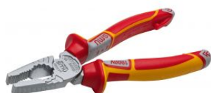
Alicata combinado de alta potencia CombiMax Serie 49 VDE at.com.es/p/1017602