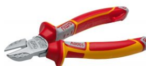
Alicata corte diagonal modelo sueco Serie 49 VDE at.com.es/p/1017606