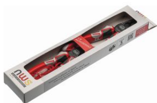
Juego de alicata universal y alicata de corte diagonal modelo sueco Serie 69 at.com.es/p/1017568