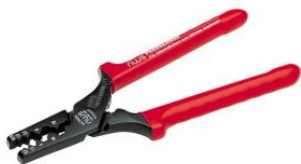
Alicate prensa terminales 0,5-16 mm 2 at.com.es/p/1017646