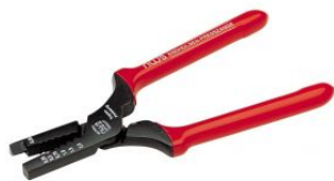
Alicate prensa terminales 0,25-2,5 mm 2 at.com.es/p/1017647