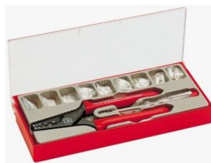
Estuche alicates prensa terminales + terminales at.com.es/p/1017648