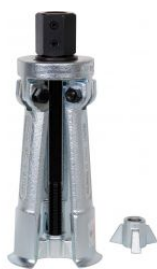
Extractor interior de 3 segmentos para rodamientos grandes