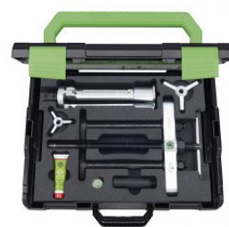
Juego de extractor para camisas de cilindro