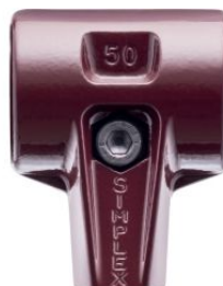
Cuerpo de acero fundido para maza Simplex at.com.es/p/1019871