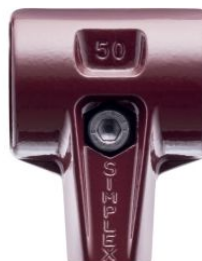
Cuerpo de acero fundido para maza Simplex at.com.es/p/1019871