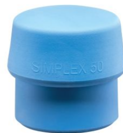
Bocas de TPE azul para mazas Simplex at.com.es/p/1017837