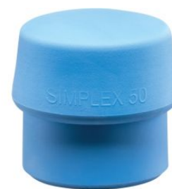
Bocas de TPE azul para mazas Simplex at.com.es/p/1017837