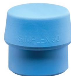
Bocas de TPE azul para mazas Simplex