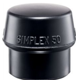
Boca de goma negra para mazas Simplex