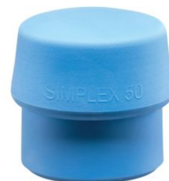
Bocas de TPE azul para mazas Simplex