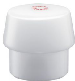
Boca de superplástico blanco para mazas Simplex