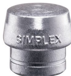
Boca de metal blando para mazas Simplex