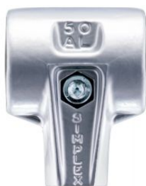
Cuerpo de aluminio para maza Simplex