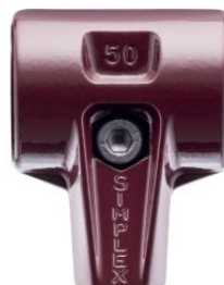
Cuerpo de acero fundido para maza Simplex