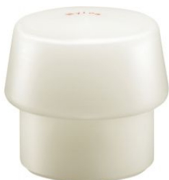
Boca de nylon blanco para mazas Simplex