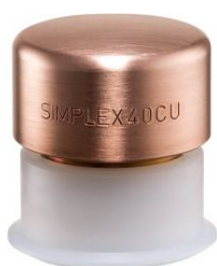
Boca de cobre para mazas Simplex