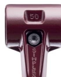
Cuerpo de acero fundido para maza Simplex