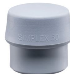
Boca de TPE gris para mazas Simplex