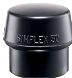
Boca de goma negra para mazas Simplex