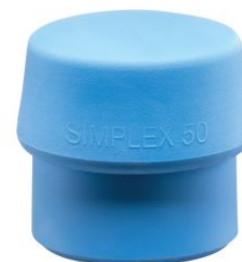
Bocas de TPE azul para mazas Simplex