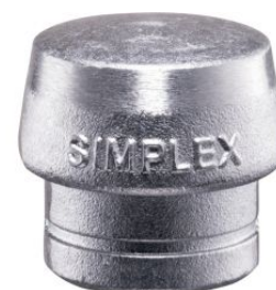
Boca de metal blando para mazas Simplex