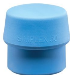
Bocas de TPE azul para mazas Simplex