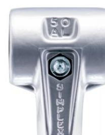
Cuerpo de aluminio para maza Simplex