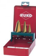
Juego de brocas cónicas HSS-TiN at.com.es/p/1017888