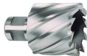
Broca hueca HSS con vástago Weldon y profundidad 30 mm at.com.es/p/1017928