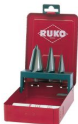
Juego de 3 brocas cónicas HSS y pasta de corte de 30 g at.com.es/p/1017886