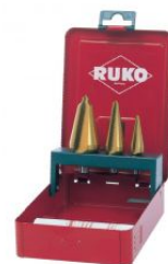
Juego de brocas cónicas HSS-TiN at.com.es/p/1017888