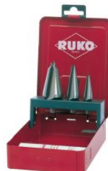
Juego de 3 brocas cónicas HSS y pasta de corte de 30 g