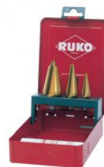
Juego de brocas cónicas HSS-TiN