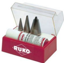
Juego de 3 brocas cónicas HSS y Spray de corte de 50 ml