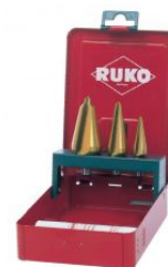
Juego de brocas cónicas HSS-TiN