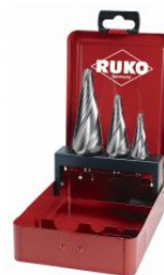
Juego de brocas cónicas para chapa HSS con canales en espiral at.com.es/p/1017891