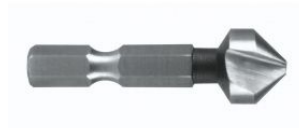
Avellanador cónico DIN 335 forma C 90° HSS mango hexagonal 1/4. at.com.es/p/1017894