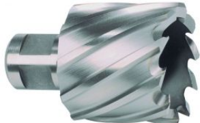
Broca hueca HSS-Co 5 Cobalto con vástago Weldon at.com.es/p/1017930