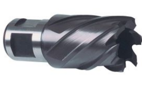
Broca hueca HSS TiAlN-FUTURA vástago Weldon at.com.es/p/1017931