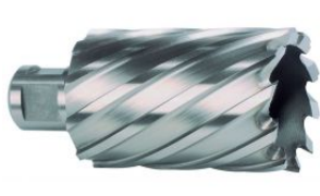
Broca hueca HSS con vástago Weldon y profundidad 55 mm at.com.es/p/1017929