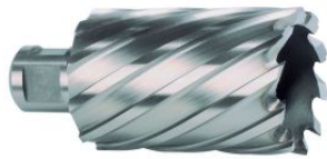
Broca hueca HSS con vástago Weldon y profundidad 55 mm at.com.es/p/1017929