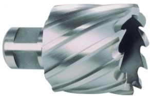
Broca hueca HSS-Co 5 Cobalto con vástago Weldon at.com.es/p/1017930