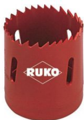
Corona perforadora HSS-bimetal con dentado variable