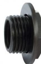
Adaptador-convertidor para adaptar a soportes A1 y A4