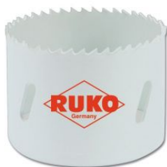
Corona perforadora HSS-Co 8 bimetal con dentado fino