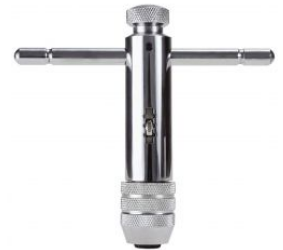
Giramachos con carraca