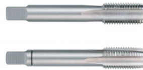
Juego de machos para roscar a mano MF DIN 2181 HSS rectificados