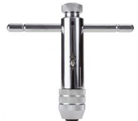
Giramachos con carraca at.com.es/p/1018097