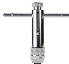
Giramachos con carraca at.com.es/p/1018097