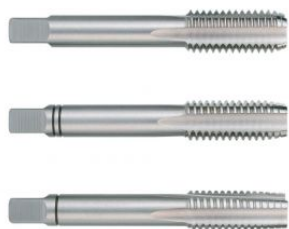
Juego de machos para roscar a mano M DIN 352 HSS rectificados at.com.es/p/1018055