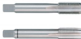
Juego de machos para roscar a mano MF DIN 2181 HSS rectificados at.com.es/p/1018058