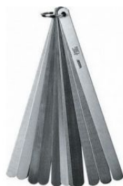
Juego galgas espesores para válvulas