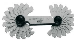
Patrones de acero para roscas