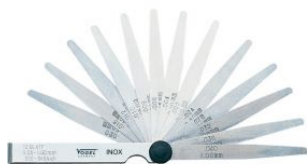
Juegos de galgas de espesores