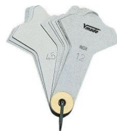
Juego galgas de soldadura