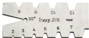
Patrón roscas trapezoidal