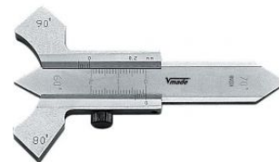
Calibre de precisión para soldaduras