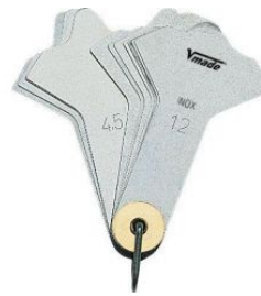
Juego galgas de soldadura