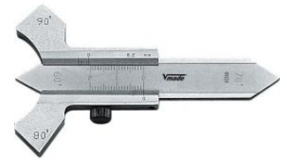
Calibre de precisión para soldaduras