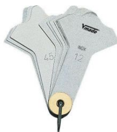
Juego galgas de soldadura