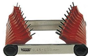
Juego calibres para inyector at.com.es/p/1018275