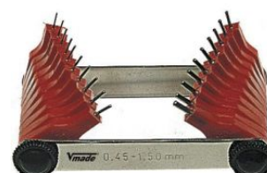
Juego calibres para inyector