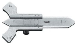
Calibre de precisión para soldaduras