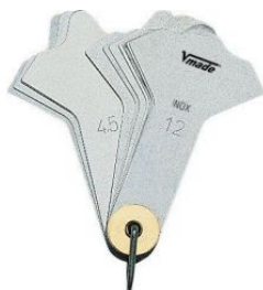
Juego galgas de soldadura