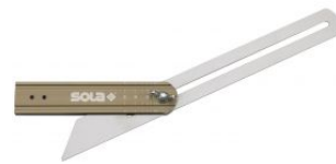
Falsa escuadra con graduación de ángulos VSTG at.com.es/p/1018353