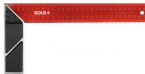
Escuadra de carpintero de acero pintado epoxi rojo SRC at.com.es/p/1018350