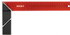
Escuadra de carpintero de acero pintado epoxi rojo SRC at.com.es/p/1018350