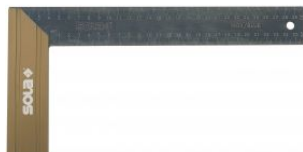
Escuadra de carpintero de acero anti-reflectante SRG at.com.es/p/1018349