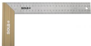
Escuadra de carpintero de acero inoxidable SRB at.com.es/p/1018348